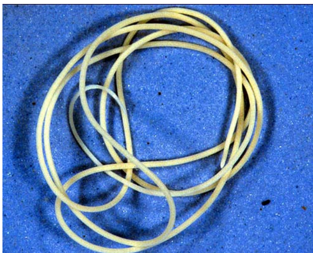
Slika 3: Odrasla živa nit