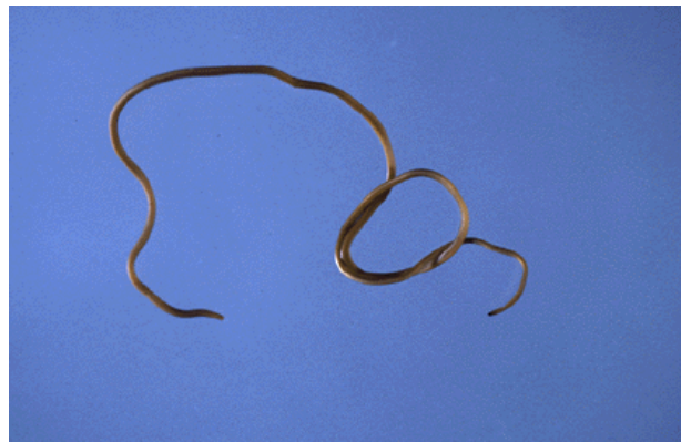
Slika 2: Odrasla živa nit www.inhs.uiuc.edu/chf/pub/surveyreports/mar-apr95/page4.html