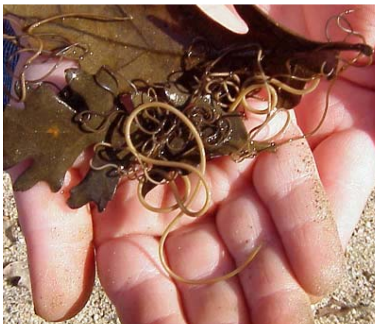
Slika 4: Žive niti

http://www.marietta.edu/~biol/biomes/images/wetlands/ihorsehair.jpg